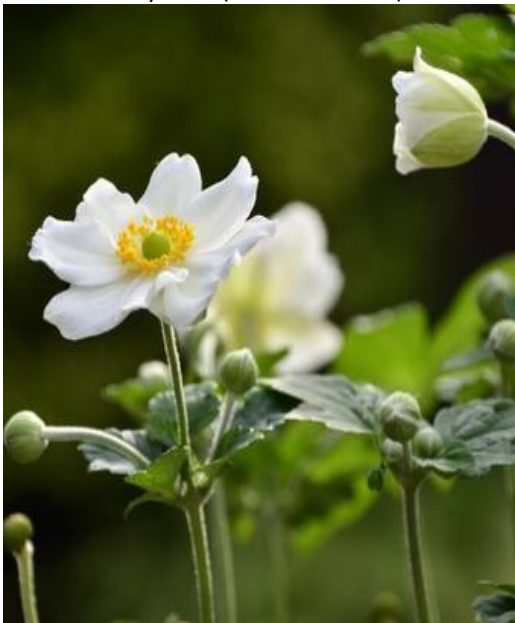
Anemone x hybrida (herfstanemoon)