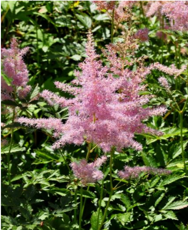
Astilbe (spirea) schaduw